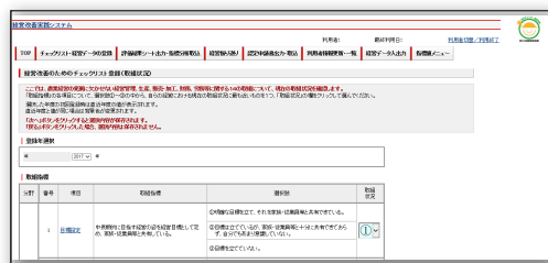
[ 経営改善実践システムの画面 ]

http://www.maff.go.jp/j/ninaite/shihyo.html